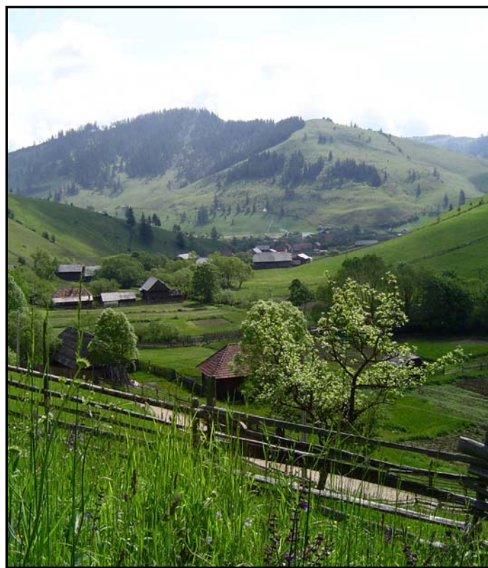
Abbildung 1: Siedlungsstruktur im Gyimes

Das Gyimes, rumänisch Ghimes, befindet sich in den äußersten Ostkarpaten, im Herzen des heutigen Rumänien. Der Name bezeichnet ein etwa 30 km langes, in Nord- Süd- Richtung ausgerichtetes Tal mit seinen Nebentälern und die umliegenden Berge. Es handelt sich um ein typisches U- Tal am Oberlauf des Flusses Tatros/ Trotus. Dieser entspringt am östlichen Hang der ostkarpatischen Wasserscheide, windet sich in Richtung Nordosten dem höchsten Kamm der Ostkarpaten entgegen und durchbricht diesen am sogenannten Gyimes- Pass, der gleichzeitig die östliche Grenze des Gyimes bildet.