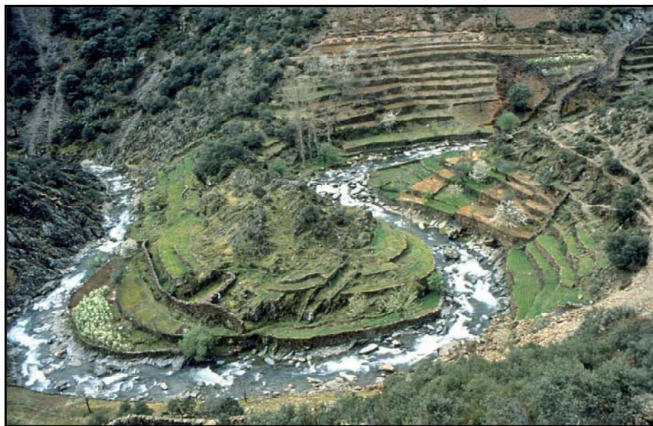
Abbildung 2: Kulturlandschaft in Las Hurdes

Wegen der schwierigen topographischen Ausgangslage blieb die Besiedlungsaktivität in Las Hurdes immer auf die engen Täler mit ihren als Lebensader dienenden Flüssen beschränkt. Das Bild der Kulturlandschaft ist geprägt durch die sehr kleinräumige Flächenaufteilung, die ein ganzes Spinnennetz an Wegen, Trampelpfaden, Trockenmauern und Bewässerungskanälen nach sich zieht. Der Großteil der Äcker und Gärten ist mit motorisierten Geräten nicht erreichbar, weswegen die meisten Arbeiten noch von Hand verrichtet werden (ebd.).